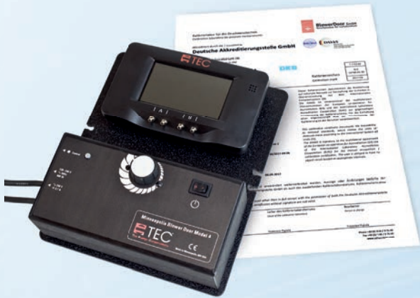
Le manomètre numérique DG-1000 avec écran tactile haute résolution, module WIFI intégré et mises à jour logicielles gratuites.