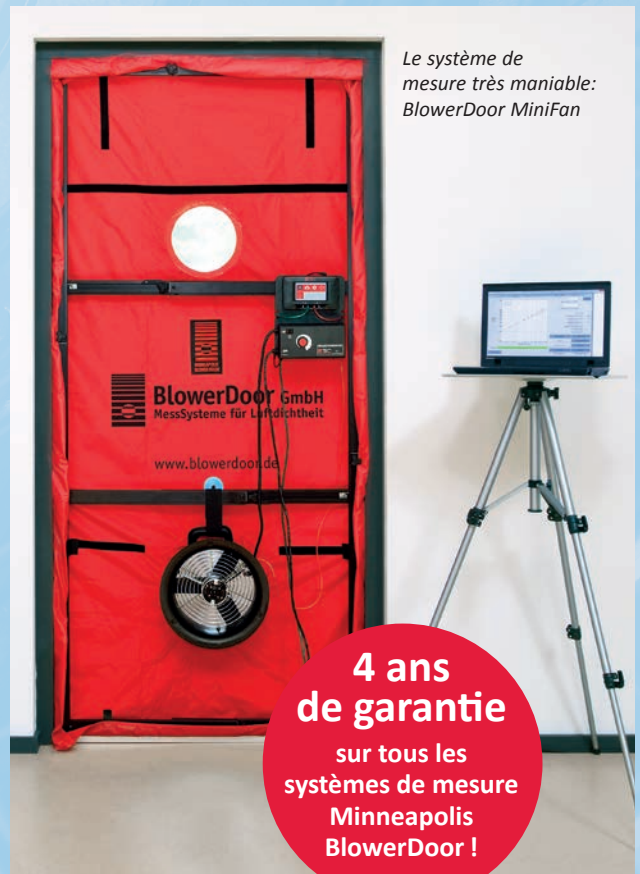
Le système de mesure très maniable: BlowerDoor MiniFan

Le pilotage du ventilateur pour les mesures en 1-point est effectué directement par le manomètre DG-1000 (fonction régulateur de vitesse), il n'est pas nécessaire d'utiliser un ordinateur. L'état de l'enveloppe du bâtiment est vérifié à l'aide d'une différence de pression au choix mais constante. Si des fuites sont détectées, celles-ci peuvent généralement être éliminées sans trop d'effort lorsque le bâtiment est en phase de construction. Les différents corps de métier peuvent ainsi rapidement attester et documenter la qualité de leur travail.