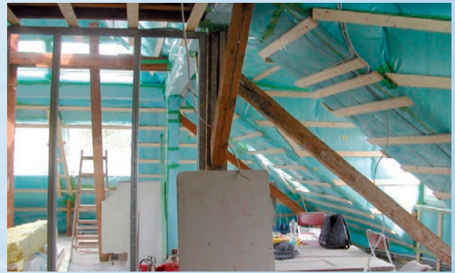
La mesure BlowerDoor pour la démarche qualité pendant la construction

dates d'étalonnage du système BlowerDoor utilisé sont inscrites dans le rapport de test et informent sur la haute précision des appareils utilisés. Dans le logiciel TECTITE Express 5.1, 12 paliers de pression peuvent être choisis par série de mesures.