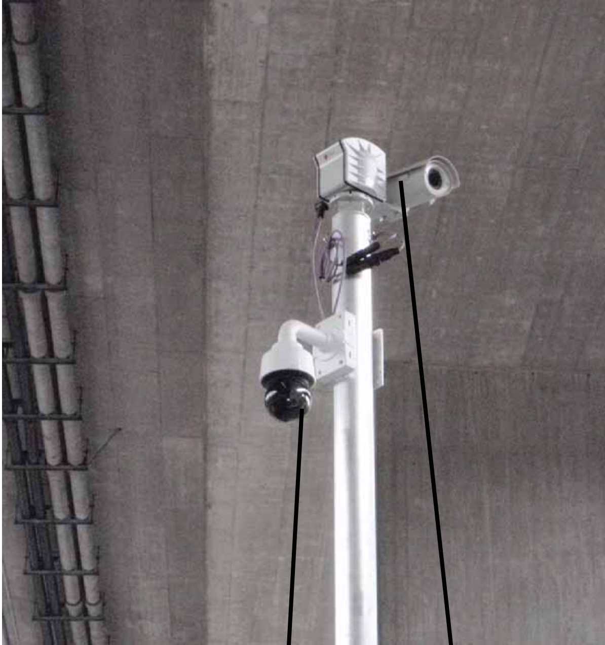
Caméra de surveillance pour levée de doute